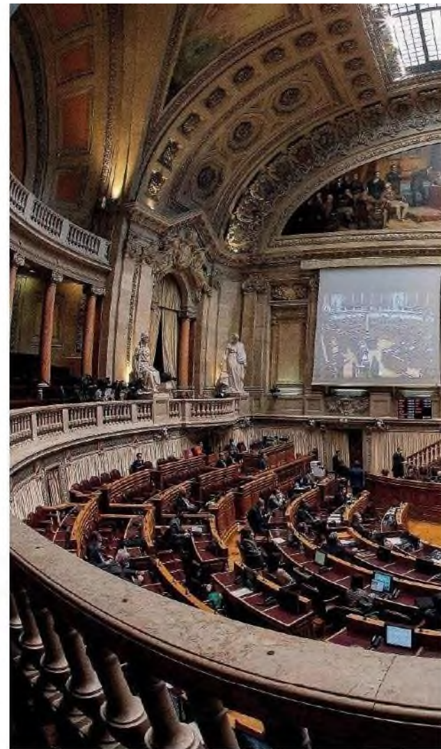
De acordo com uma análise da CMS Portugal, a diretiva que justifica a mudança