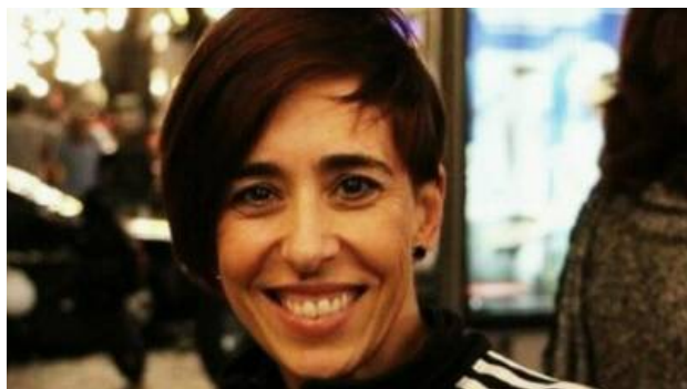
Café Memória aborda promoção do envelhecimento activo