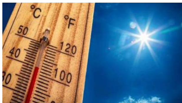
IPMA estende aviso amarelo devido ao tempo quente até amanhã na Madeira