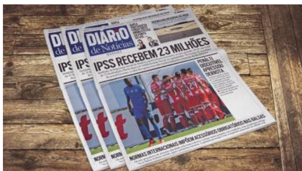
IPSS da Madeira receberam 23 milhões de euros em 2018