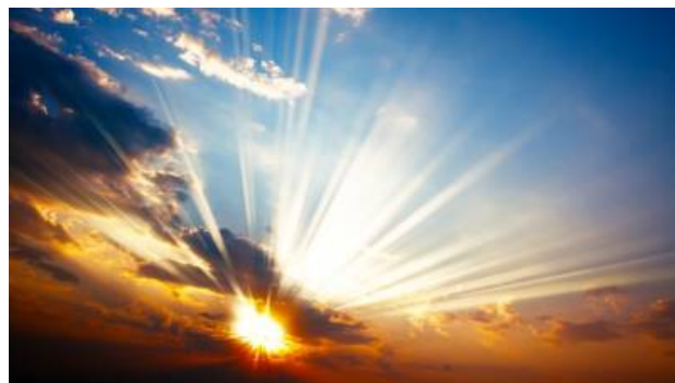
Todo o arquipélago da Madeira sob aviso amarelo para tempo quente